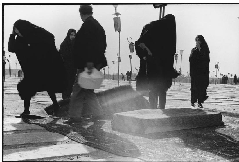
عکس صفحه ۶۳ کتاب

عکس‌های صفحات ۵۶ تا ۶۲ کتاب، ادامه همان مستندنگاری احمد عالی از مردم روزمره و کنکاش وی در فرهنگ و زندگی عادی مردم هستند. عکسی از رفت و آمد مردم در خیابان و آنتن‌های روی سقف یک خانه و کسانی در فضای باز در حال اصلاح سرو صورت خود که همان نگاه مبتدیانه یک عکاس کنجکاو را نشان می‌دهد. در صفحه ۶۳ کتاب تک عکسی با عنوان قم ۱۳۴۰ آورده شده که نگاه را به خود جلب می‌کند. این عکس دارای شرایط و ویژگی‌های متفاوتی با دیگر عکس‌ها است. این تصویر نشان دهنده یک رویکرد نو در نگاه عکاس به شرایط اجتماعی و توجه عکاس از سطح تصویر به لایه‌های زیرین عکس، که اندیشه عکاس در آن نهفته وجود دارد. با کمی دقت به آثار قبل و بعد این عکس متوجه نوعی گذار از رویکرد سطحی گذشته و جدا شدن وی از آن و ایجاد رویکرد زیبایی‌شناسانه و فلسفی و ورود به یک دنیای مفهومی و فرمی که نوعی الهام و تأثیری پذیری از عکاسی غرب در آن دیده می‌شود وجود دارد. عکس‌های وی از تهران، شیراز، کاشان، اصفهان، ریوش و بم نشان دهنده این نگاه فرمالیستی احمد عالی هستند. در این آثار هیچ توالی زمانی، مکانی رعایت نشده و تنها دغدغه نگاه فرمالیستی در آنها بوده که اهمیت داشته است. این نگاه در تمام آثار موجود در کتاب، رعایت شده است.